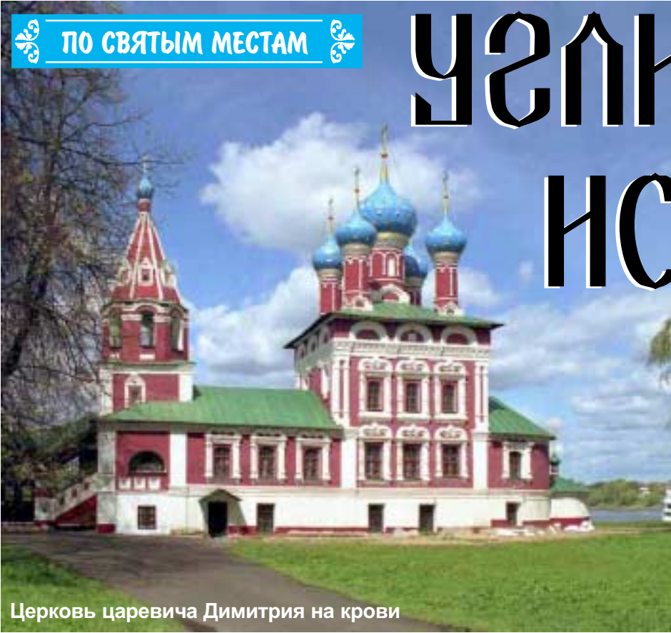
Церковь царевича Димитрия на крови

Приезжая первый раз в тот или иной патриархальный русский городок, я неизменно очаровывался той особенной, присущей только ему атмосферой неторопливости бытия, уникальными запахами ветхих деревянно-каменных строений. Причем запах этот не запустения и тления, а живого организма, который существует в странном симбиозе одушевленной и неодушевленной природы. При внешней схожести городов «Золотого кольца» или российской глубинки, все они самобытны и не похожи друг на друга.