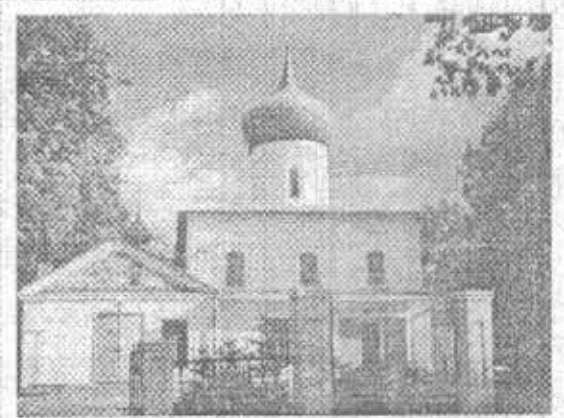
Храм святого Георгия Победоносца

ми и тронулась в предстоящий путь. Во всех церквях по пути следования иконы служились молебны; святыню встречали и сопровождали тысячи людей. Деревни и поселки на пути крестного хода украшались арками с флагами, полевыми и садовыми цветами, зеленью. 2 и 3 сентября путь святыни проходил под проливным дождем со снегом, на дорогах была непроходимая грязь. Но и это не останавливало народ. Крестный ход, сопровождаемый тысячами богомольцев под непрерывное пение, представляет грандиозное и величественное зрелище.