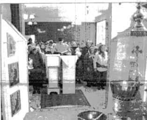
Читается Апостольское послание.