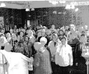
Молится в храме Казанской иконы Пресвятой Богородицы.