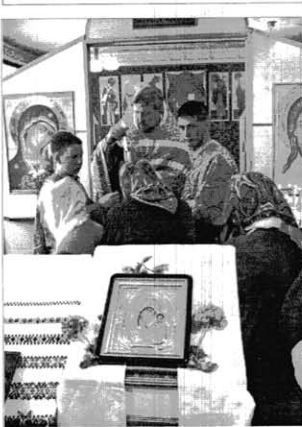
Причастие на престольном празднике.