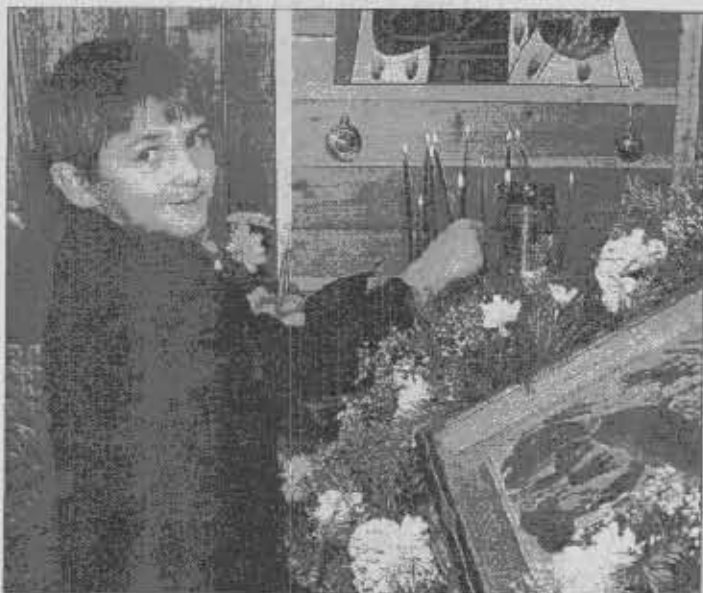
Рождество Твое, Христе Боже наш, ангели поют на небесах...

– В преддверии освящения «Свято-Покровской» церкви, которое состоится в воскресенье, 6 июня, разрешите от всех прихожан храма пожелать Вам доброго здоровья, благополучия, мира, душевного тепла и радости, дальнейших успехов в высоком служении Православной Церкви. А душевной доброты, мы знаем, у Вас хватит на всех!