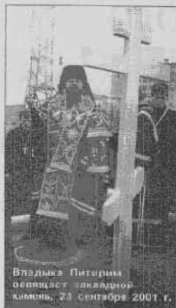
Владыка Питирим благословляет закладной камень, 23 сентября 2001 г.

Из истории создания Свято-Покровской церкви в г. Ухте