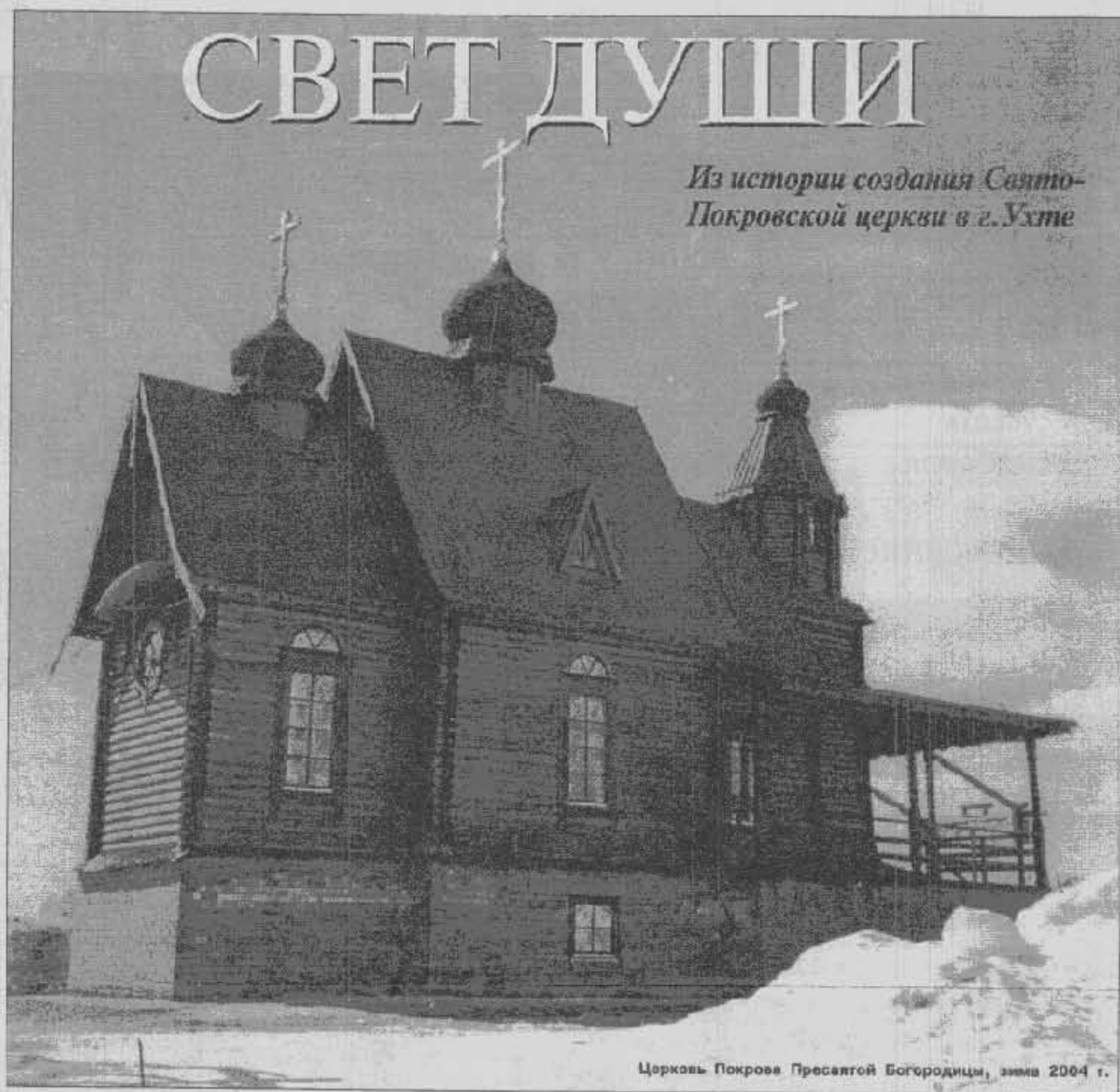
Церковь Покрова Пресвятой Богородицы, зима 2004 г.

Открытие православной епархии в крае имело важное значение для мудрого, немно-